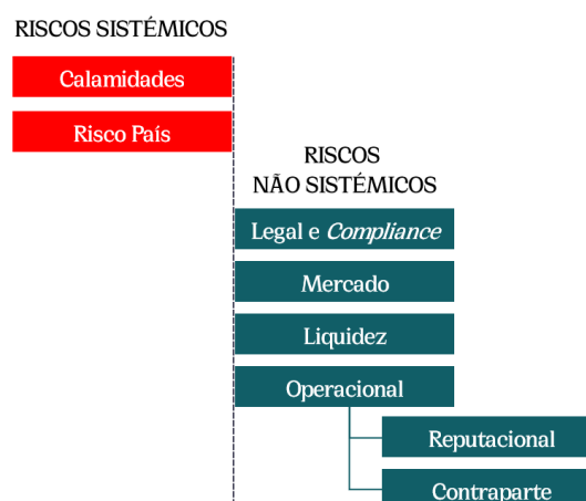
Figura 1: Taxonomia de Riscos sistêmicos e não sistêmicos

Considerando a existência de uma ampla diversidade de eventos e cenários de risco, e recorrendo a algumas definições preconizadas, estão identificados e caracterizados os principais riscos a que a Organização está exposta: